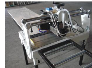
↑ サイド延長ローラー (別売)