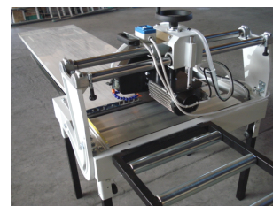
↑ サイド延長ローラー (別売)